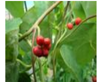
タマサキツツラフジの実