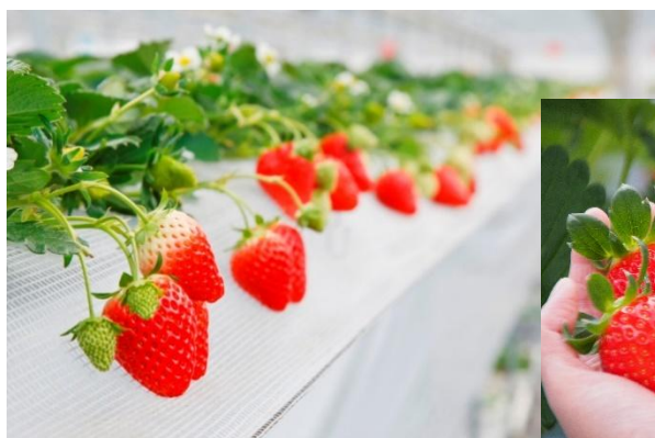
▲今シーズンは「かおりの」「紅ほっぺ」「おい C ベリー」「すず」の 4 品種。

イチゴ狩りからスイーツまで、山田みつばち農園ならではの“イチゴの楽しみ方”を一日中満喫できます。