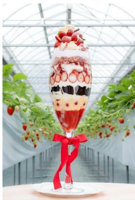
ハニーストロベリーパフェ ロイヤル 8,300 円（税込）