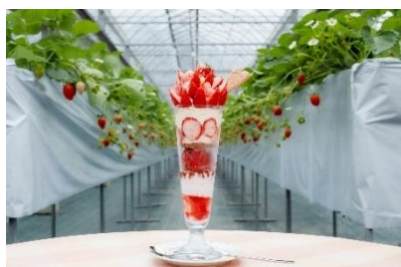
ハニーストロベリーパフェ レッドジュエル 2,200 円（税込）