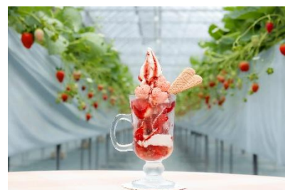
ハニーストロベリーパフェ ミニジュエル 850 円（税込）

※「ハニーストロベリーパフェ ロイヤル」は、1 月 10 日（土）～4 月上旬の限定販売。1 日 1 組様限定で、3 日前までの予約が必要です。