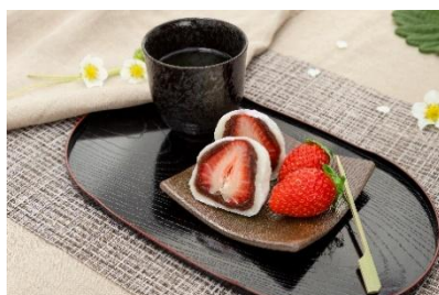
いちご大福 白 500 円（税込）