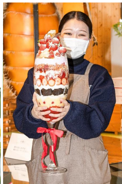
▲ハニーストロベリーパフェ ロイヤル