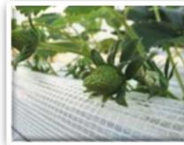
③花托（花床）がふくらんで実ができます。