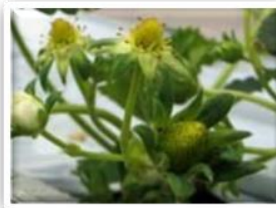
②イチゴの雄しべが黒くなり、花びらが自然に落ちます。