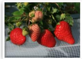
④ミツバチが花粉媒介（ポリネーション）をしてから、約45日で収穫します。