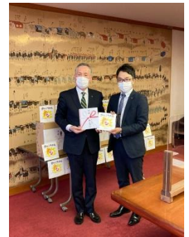
▲昨年の寄贈式の様子