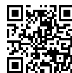
▲みつばち文庫 WEB サイト