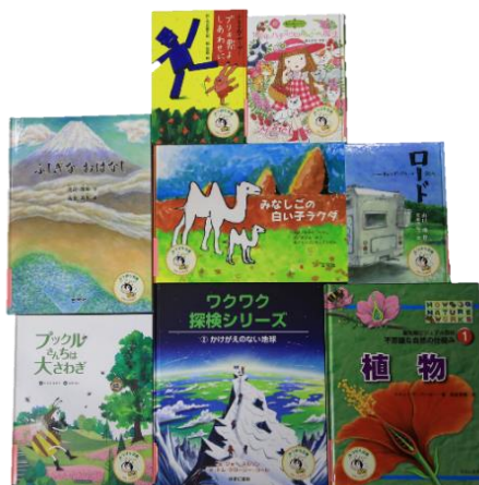
▲前回（第22回）寄贈した児童書や絵本は8冊を1セットとして、全国1,975校の小学校に寄贈

※当選した場合、配送料1,000円を負担することに同意していただける方のみご応募ください。