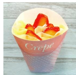
▲苺ハニーワッフル(税込 900 円)