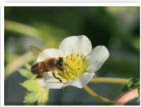
①花の中心をミツバチがくるくる周り、花粉をつけます。