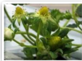
②イチゴの雄しべが黒くなり、花びらが自然に落ちます。