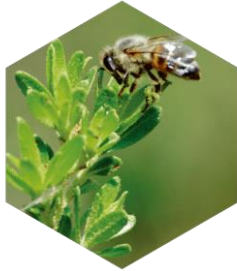
植物の新芽や樹脂から つくりだされるプロポリス

プロポリスとは、ミツバチが巣を守るため植物の新芽や樹脂からつくりだす“天然の防御壁”。桂皮酸誘導体やフラボノイドをはじめ、各種ビタミン、ミネラルなどの有用成分を豊富に含んでいる。