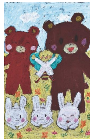
▲子どもの部・最優秀賞受賞作品