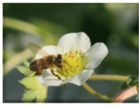
①花の中心をミツバチがくるくる周り、花粉をつけます。

◆イチゴの実ができるまで ※12月以降はイチゴハウス内で下記①～④の全てが見られます。ぜひご取材ください。