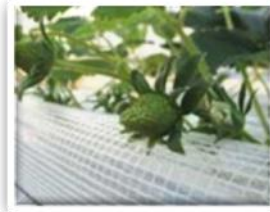
③花床がふくらんで実ができます。