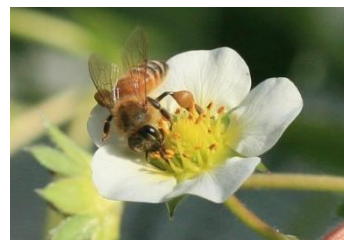
▲イチゴハウス内では、ミツバチが花にとまる様子を見ることができます。