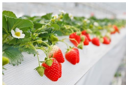
▲ミツバチの花粉媒介（ポリネーション）によって実ったイチゴ