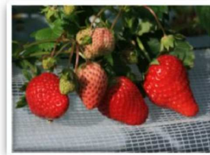
④ミツバチがポリネーション（花粉媒介）をしてから、約45日で収穫します。