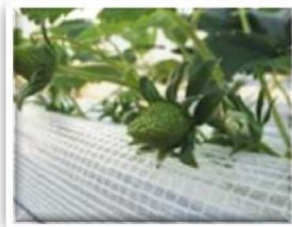
③花床がふくらんで実ができます。