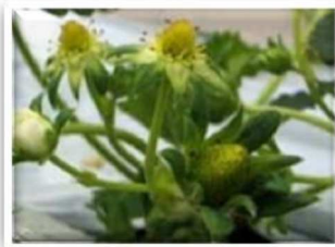
②イチゴの雄しべが黒くなり、花びらが自然に落ちます。