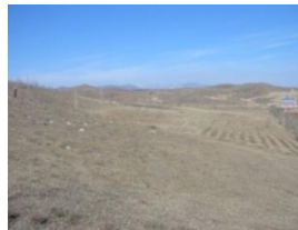
植樹前の林西県(2004年撮影)

2004年より現地の植生に合った木々を植える宮脇式植樹を啓発・実施してまいりました。