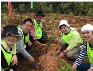
広州市採石跡地での植樹の様子(2015年3月撮影)

そこで、土地本来の樹種に基づく植樹(宮脇式)を実践する宮脇昭教授の指導のもと、日系企業として初めて広州での植樹をスタートいたしました。本年度は試験植樹として約1,000本の植樹を実施、来年2016年より本格的な植樹をスタートさせ、年間4万本の植樹を行い、5年後の2020年までに約20万本の植樹を実施していく予定です。