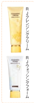
RJクレンジングクリーム

本体から取り外せる「2段キャップ」を採用。最後の1回分は、本体からキャップを取り外し、清潔な綿棒などで、直接すくってお使いいただけます。