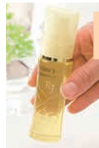
薬用 RJエッセンス/ さらり