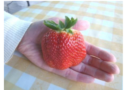
—昨年採れた「かなみひめ」 (75g) とても大きくなるのが特長です。