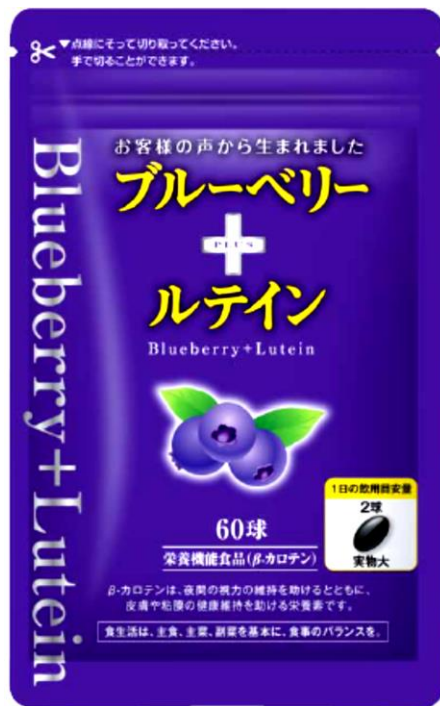
写真データが必要な際はご連絡ください。

注目のアントシアニンを豊富に含むビルベリーエキス、β-カロテンに加え、有用性の高いルテインをはじめ、ビタミンB 12 、メグスリノキエキスを新たに配合。“見る”“読む”を楽しむ、鮮やかな毎日をサポートします。携帯電話やパソコンをよく使う方、読書を満喫されたい方、細かい作業を長時間続けたい方におすすめです。