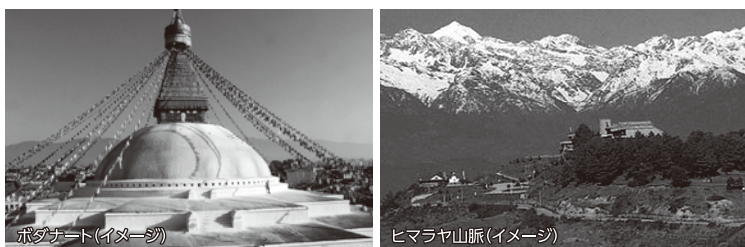
ポダナート(イメージ)