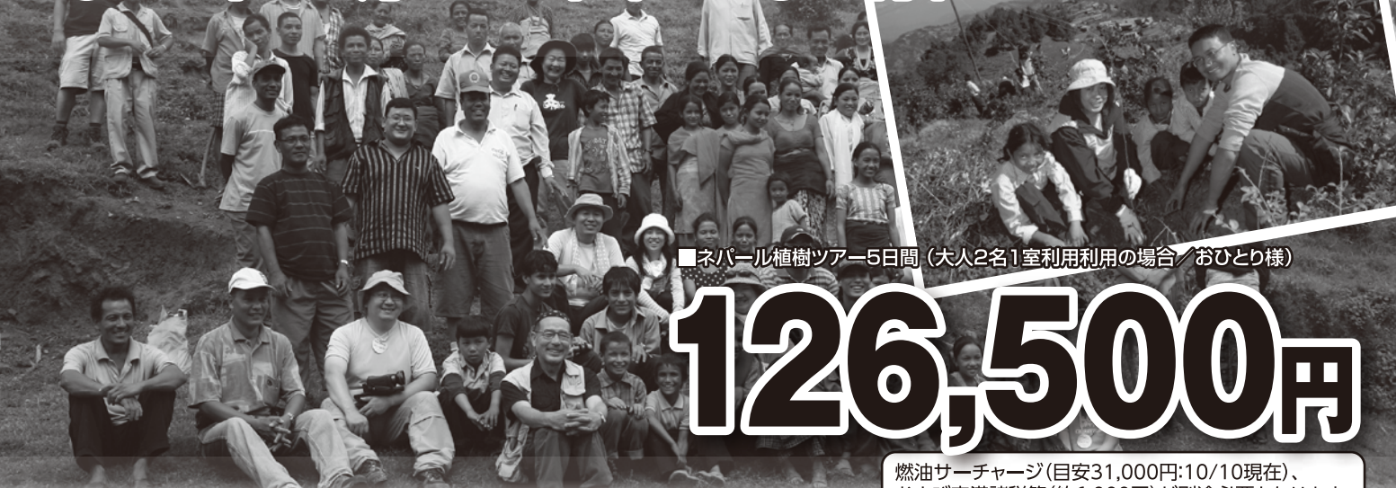
■ネパール植樹ツアー5日間(大人2名1室利用の場合/おひとり様)