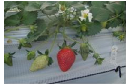
昨年新登場で人気の「やよいひめ」は、今年も楽しめます。