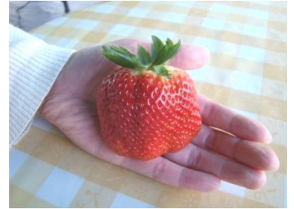
昨年採れた「かなみひめ」(75g)とても大きくなるのが特長です。

「さつまおとめ」を母親に九州で育種された新品种です。極大果と言われるように、大きく甘いのが特長です。