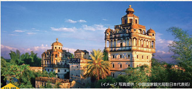
(イメージ)