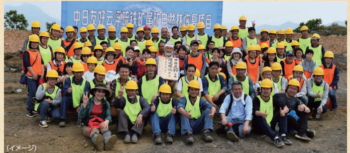
(イメージ) 中日友好云浮硫鉄礦尾礦自然林修復項目