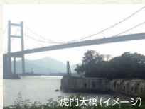
虎門天橋(イメージ)

中国の近代史で避けることのできないのがアヘン戦争です。アヘン戦争の発端となった土地が広東省東莞市虎門です。虎門には戦争で使われた砲台が残り、近くのアヘン戦争記念館にはアヘン戦争に関する文書や資料が展示されています。