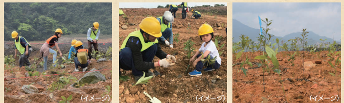
(イメージ) 日本と中国、力をあわせて一緒に植樹をします (イメージ) 子供たちのためにも豊かな地球を残そう (イメージ) 宮脇式植樹直後の様子 多種類の密植・混植が特徴